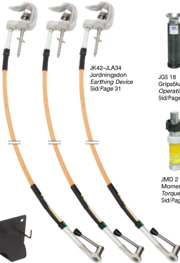
JK42-JLA34 Jordningsdon Earthing Device Sid/Page 31