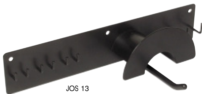
JOS 13 Upphångningsstativ Storage Rack Sid/Page 142