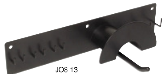
JOS 13 Upphångningsstativ Storage Rack Sid/Page 142