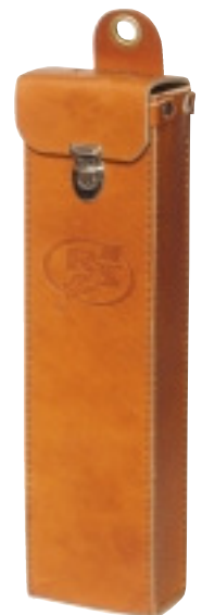
DFO/TAG Fodral/Case Sid/Page 148