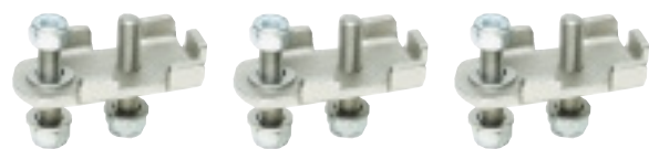
JVF 11 Kontaktdon mot jord Contact Fitting to Earth Sid/Page 101