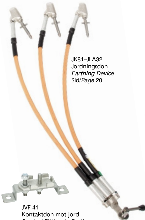
JVF 41 K Kontaktdon mot jord Contact Fitting to Earth Sid/Page 102