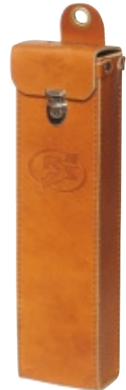
DFO/TAG Fodral/Case Sid/Page 148