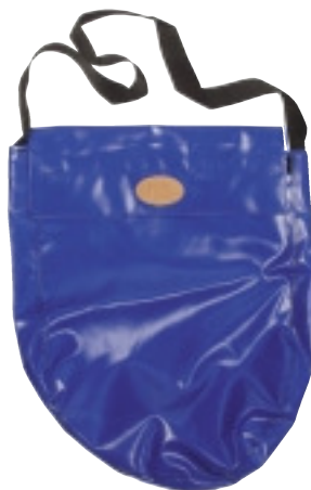
DFO/JSKL1-J Fodral/Case Sid/Page 124