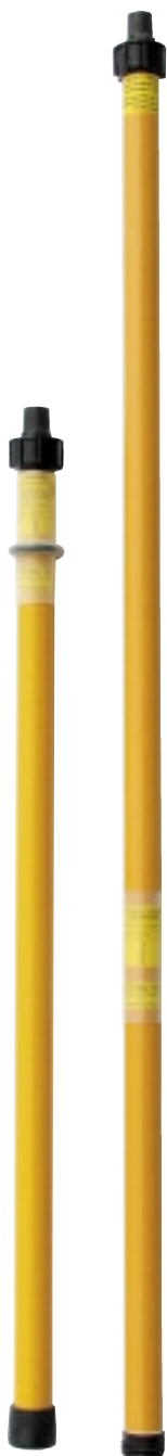
MDV 150 Manöverstång Greppdel Operating Pole Hand Grip Section Sid/Page 107