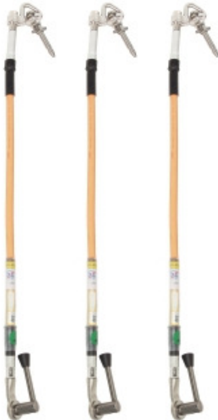
JFS21-JLA34 Jordningsdon Earthing Device Sid/Page 16