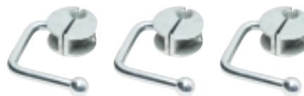
JKA Kontaktdon Contact Fitting Sid/Page 95