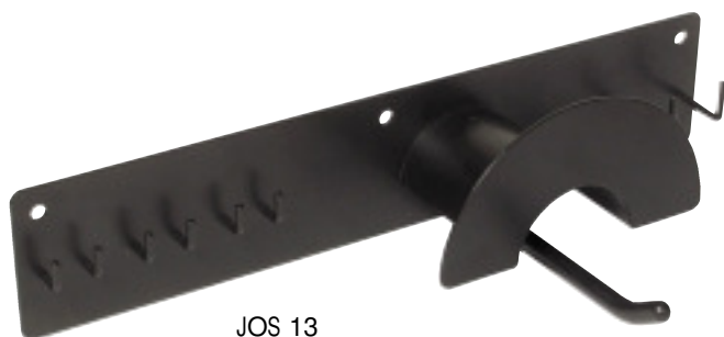
JOS 13 Upphångningsstativ Storage Rack Sid/Page 142