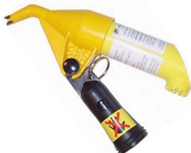
Spänningsprovare avsedd för kapacitiva uttag TAG 200 BC 12-36 E-nr: E 42 098 73