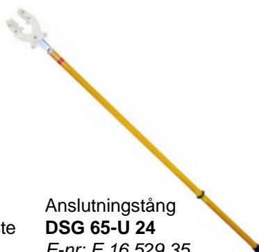
Anslutningstång DSF 65-U 24 E-nr: E 16 529 35