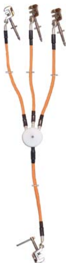
Jordningsdon JK27-X-JK27V E-nr: E 16 589 21