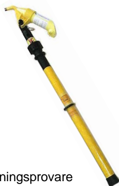
Spänningsprovare TAG 200 BC på manöverstång MGV/VTU-BC