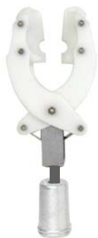
Tånghuvud med verktygsfäste DSF 65-VF E-nr: E 16 529 34