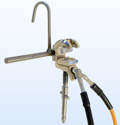
Ledarklämma JK 27P med avtagbar krok och tvärpinne!