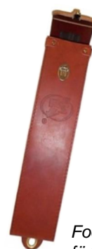
Fodral DFO/TAG för spänningsprovare