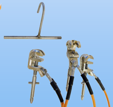
Avtagbar krok och tvärpinne vid användning i ställverk!