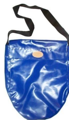
Fodral DFO/JSKL1-J för jordningsdon