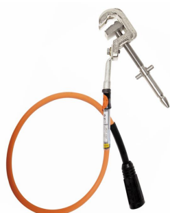
1-fas jordningsdon JK27-DXF x/1,5 Längd donlina=1,5 m x) Donlinarea