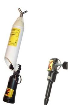
Spänningsprovare TAG 220 med adapter TAG/RS Adapter för gripsökare, TAG/JGS