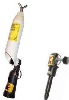
Spänningsprovare TAG 220 med adapter TAG/RS Adapter för gripsökare, TAG/JGS