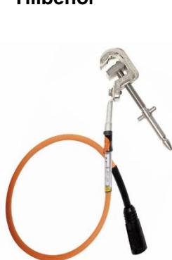
1-fas jordningsdon JK27-DXF x/1,5 Längd donlina=1,5 m x) Donlinarea