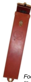
Fodral DFO/TAG för spänningsprovare