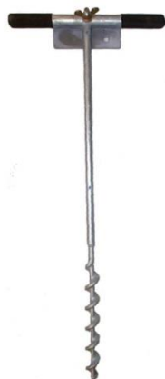
Maaruuvi DJS 1