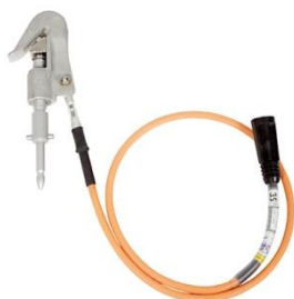
1-vaiheinen maadoituslaite JSKL1-STG Johtimen pituus 1,5 m

Käyttöjännite 0,4 - 52 kV. Maadoituslaite tyyppin JSKL liittimellä on kehitetty sellaiseksi, että se voidaan nopeasti ja helposti liittää avojohtoihin (halkaisija 1 - 25 mm, Cu 10 mm 2 - FeAl 329 mm 2 ). Liitin voidaan liittää vinottain johdinta vasten, mikä helpottaa asennusta merkittävästi. Johdinliittimessä (JSKL-STG) on trapetsikierre , jossa liittimen kiristys tehdään vain muutamalla kierroksella. Linjajohdinlaitteesta on saatavana myös pikalukitusliittimellä varustettu versio. Tyyppimerkintä on tällöin JSKL3-SQL.