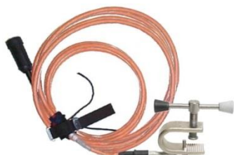
1-vaiheinen maadoituslaite JK238-DXF Sopii käytettäväksi maadoitusjohtimena. Käytetään teräsrakenteissa, joiden materiaalipaksuus on enintään 30 mm.