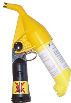
Spänningsprovare TAG 200 BC Längd: 275 mm Vikt: 0,45 kg